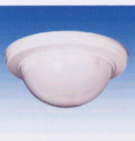
パッシュセンサー