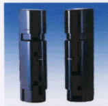
赤外線センサー 玄関・駐車場入り口に